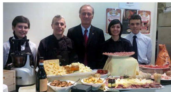
Il Prosciutto Crudo Cuneo DOP a Fruit Logistica.