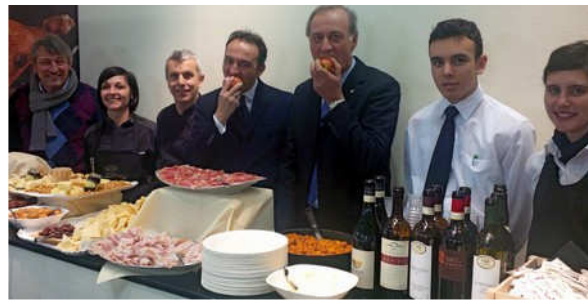
L'assessore regionale Cirio per la Mela Rossa Cuneo IGP.

Banqueting di alto livello, grazie al servizio dell'Istituto Alberghiero di Dronero - coordinato dal docente Mauro Prato - con una degustazione no-stop dell'agroalimentare cooperativo piemontese a base di salumi, formaggi, specialità sotto vetro, dolci tradizionali, vini doc e docg offerti da Fedagn Piemonte.