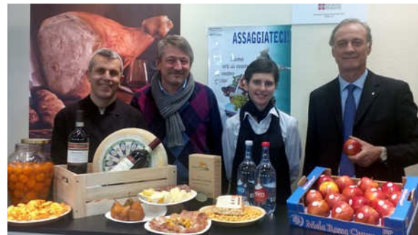
Fedagri Piemonte a Fruit Logistica.

Battezzate e aggregate nella brand-identity "Made in Piemonte", circa 20 aziende tra le più rappresentative del territorio regionale sono state protagoniste dell'area espositiva, realizzata grazie al sostegno dell'Assessorato all'Agricoltura della Regione Piemonte, unitamente al FEASR-Fondo Europeo Agricolo per lo Sviluppo Rurale, con il coordinamento organizzativo di Assortofrutta (l'Associazione dei Consorzi per la valorizzazione e tutela delle produzioni) ortofruttilico a marchio collettivo della provincia di Cuneo e del Piemonte), in collaborazione con Fedagri-Confindustria Piemonte e Cuneo.