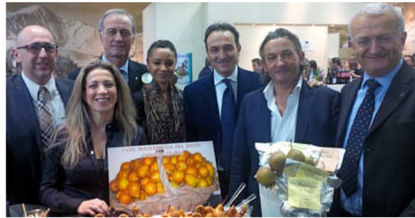
L'assessore regionale Cirio per la Mademassa.

Con la "Rossa" cuneese, altre due star dell'agroalimentare della provincia "Granda" hanno conquistato il folto pubblico di operatori in visita: la Pera Mademassa del Roero - promossa in loco dal Comune di Guarene, presente nello spazio Piemonte - e il Prosciutto Crudo Cuneo DOP, offerto dalla storica azienda Carni Dock di Lagnasco (produttore autorizzato dal Consorzio di Tutela).