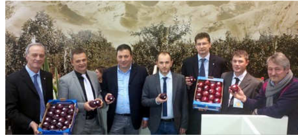
Una rappresentanza dei produttori di Mela Rossa Cuneo IGP a Fruit Logistica.

Tappa di successo e grande visibilità quella del Piemonte ortofruttilico, recentemente in scena a Berlino in occasione della 22ma edizione di Fruit Logistica, con un open-space di grande effetto.