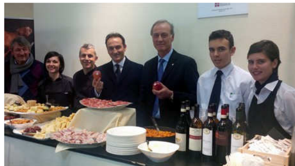
L'assessore regionale Cirio per la Mela Rossa Cuneo IGP.

Diffusa nei principali info-point della fiera, infine, la depliantistica bilingue (tedesco/inglese) curata dalla Camera di Commercio di Cuneo - nell'ambito della collana editoriale dal titolo "Cuneo Frutta e Ortaggi - Il Cuore dell'ortofruticoltura nella provincia di Cuneo" - distribuita in tutti i tre giorni di durata della manifestazione.